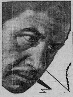
Un estreno de los grandes para para mañana jueves la empresa del Raventós para justificar una vez más que su Jueves de Moda no sólo son los más concurridos de la capital sino también que se ofrecen las mejores películas y las que más gustan al público josefino.

Su estreno mañana será uno de los más grandes éxitos de la empresa del Raventós, lo aseguramos.